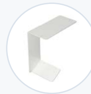
Druckerhalterung, Zebra QLN220 WF-PBRKT-ZQLN2