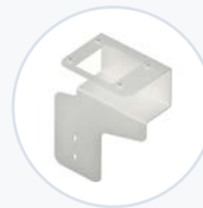
Scannerhalterung, Code 2600 WF-SCNBRKT-CD2600