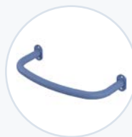
Verlängerter hinterer Griff, Stahl WF-EXRHAND