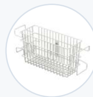
Vorderer Zubehörkorb, Draht WF-FSUPBASK-W