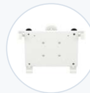
Tablethalterung, neigbar/schwenkbar WF-TAB-MNT