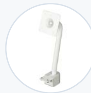
VESA-Halterung, leichte Ausführung WF-VESA-MNT-LT