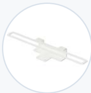
Rollständer-Laptop Sicherheitshalterung WF-RLT-SECBRKT