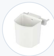
Seitlicher Zubehörkorb-Set WF-SSUPBIN

Um Ihren Anwendungsanforderungen gerecht zu werden, können Sie im Laufe der Zeit die Ausstattung durch hinzufügen oder entfernen des Zubehörs ändern.