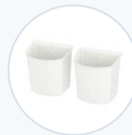
Rückseitige Zubehörkorb-Set WF-RSUPBINS