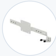
Scannerhalterung, VESA-Halterung WF-SBRKT-VESA