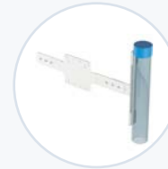
Getränkhalter, VESA-Halterung WF-MEDCUP-VESA