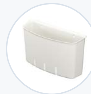
Hinterer Zubehörkorb, Polymer WF-RSUPBASK-P