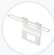
Laptop- Sicherheitshalterung WF-CLT-SECBRKT