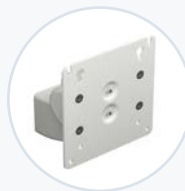
VESA-Halterung, neigbar/schwenkbar WF-VESA-MNT