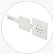
E-Signatur-Pad, VESA-Halterung WF-SIGNPAD-VESA