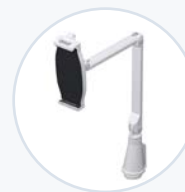
Tablet, Oberflächenmontage AM-TABMNT-S