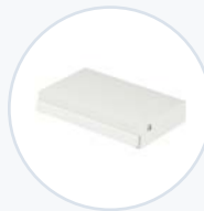
Schublade, einzeln, verriegelbar WF-DRWR-SL