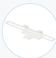
筆記型電腦輪架固定架 WF-RLT-SECBRKT