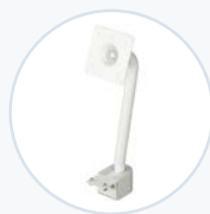
輕型 VESA 固定架 WF-VESA-MNT-LT