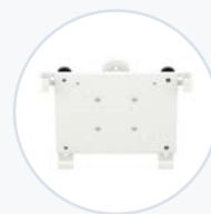
平板固定架， 可傾斜/旋轉 WF-TAB-MNT