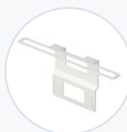
筆記型電腦固定架 WF-CLT-SECBRKT